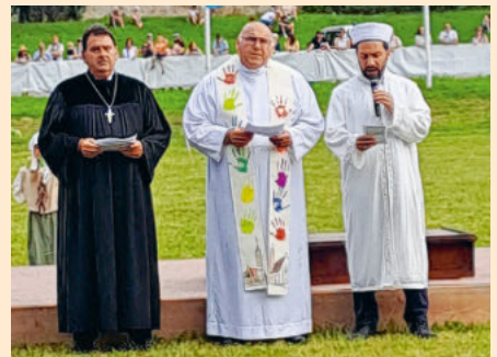
Ökumenische und interreligiöse Segnung am Schwäbischwerder Kind