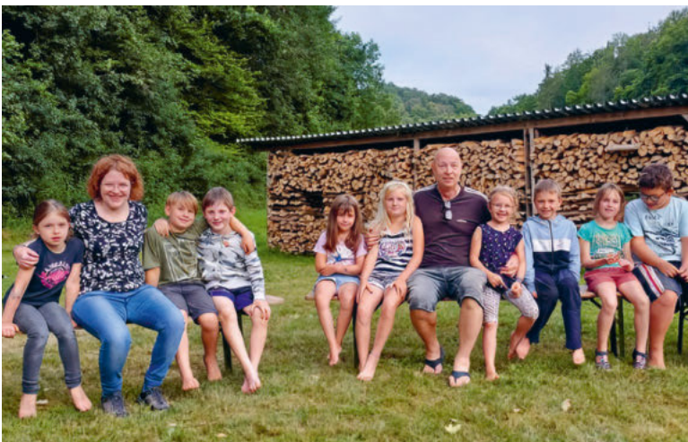
Zusammenarbeit auf dem Trainee-Wochenende