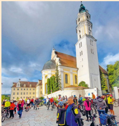
Ökumenische Radwallfahrt nach Augsburg