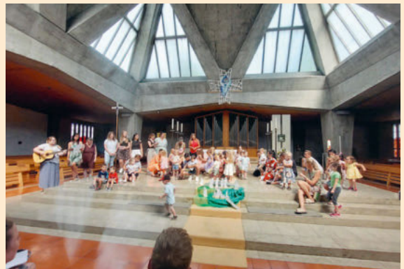
Abschiedsfeier in der Montessori-Kinderkrippe