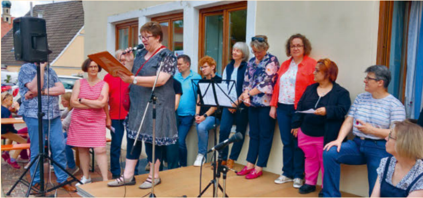
Vorstellung Kandidierende KV beim Gemeindefest